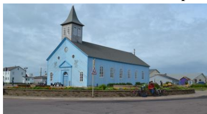
Eglise ND des Ardilliers - Miquelon