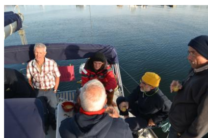
La flottille en pleine réflexion sur Phileas

Sur l'unique quai en bois de l'école de voile municipale, six voiliers arborant les couleurs nationales et le guidon MédHermione attisent la curiosité des Saint Pierrais et de la presse locale. Pendant une semaine nous faisons la une de la chaîne locale de télévision « SPM 1 ère » (1) et de la radio. Les interviews et reportages se succèdent à bord de nos voiliers ou encore à l'office du tourisme. Dans les rues, les célébrités éphémères sont abordées par les auditeurs et téléspectateurs intrigués par cette poignée de « Mailloux » (2) peu ordinaires.