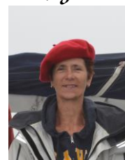
St Pierre Embarquée à bord de Philéas