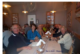
Le bar à choix