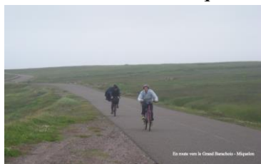
En route vers le Grand Barachois

A défaut de véhicule disponible quelques téméraires affrontent même, à bicyclette pluie, froid et vent de bout pour rejoindre le Grand Barachois, site privilégié pour l'observation des phoques et oiseaux migrateurs. Rendez-vous manqué, aucun phoque ne montre le bout de ses moustaches ! Trempés jusqu'aux os, ils rebroussement chemin pour aller déguster, au Bar à choix , une délicieuse omelette aux saints Jacques avec leurs camarades moins intrépides.