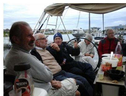
Autour d'un morito éraunisien

Miquelon et Langlade, les sœurs jumelles de l'archipel reliées par un cordon ombilical de 12 kilomètres, un isthme de sable, nous font un appel du pied. Au fil des siècles plus de 600 navires se sont échoués entre les deux îles. Il est dit, qu'ils ont, peut-être, contribué à la formation de cette bande de sable. Les plus courageux font fi du mauvais temps et embarquent à bord du Cabestan . (3) pour fouler une parcelle de ces 200 km 2 prometteuse d'un environnement naturel riche et paisible.