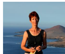
Embarquée à bord de PHILEAS