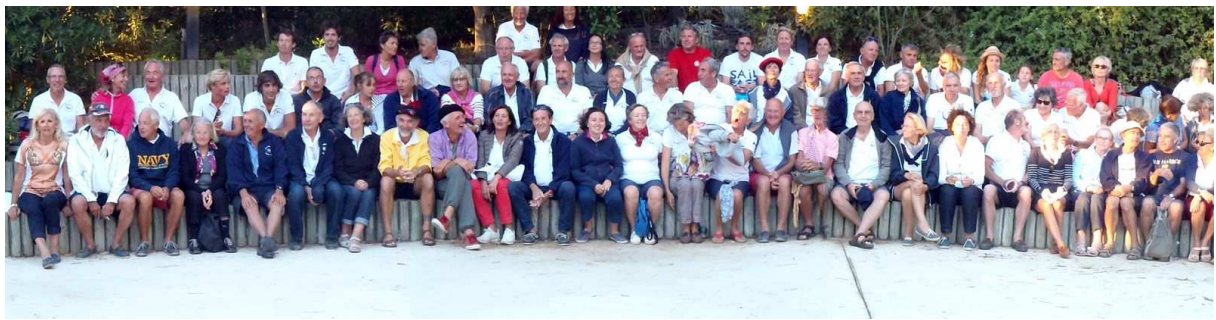
Les héros en débriefing à Porquerolles

A cette question, Jack London a déjà répondu le 11 avril 1911 à bord de son voilier Roamer :