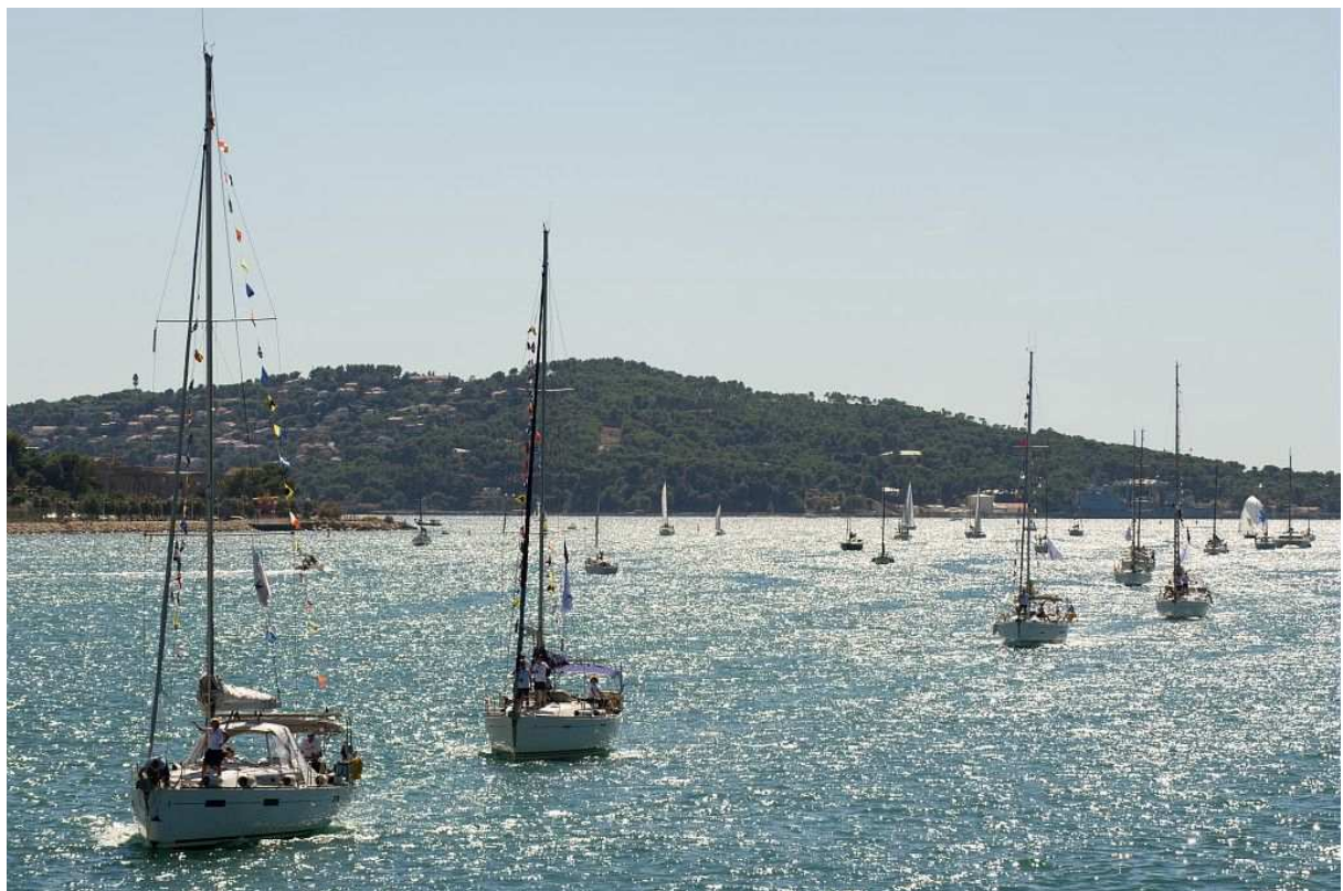
En route vers de nouvelles aventures !

« Et puis, marin un jour, marin toujours. Le goût du sel jamais ne s'évente. Le marin ne vit jamais assez vieux pour n'avoir plus envie d'aller affronter une fois encore le vent et les vagues »